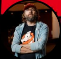
Sébastien Blanc @sebi2706 Vous suit