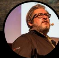
Side Projects' Gardener @k33g_org Vous suit